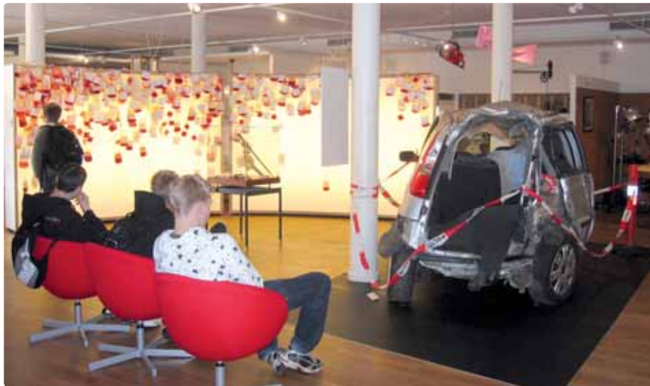
Mon den forulykkede bil gør indtryk på eleverne fra 7. klasse på Vejlbyskole?

Udstilling på Steno Museet 7. maj til 23. december 2009.