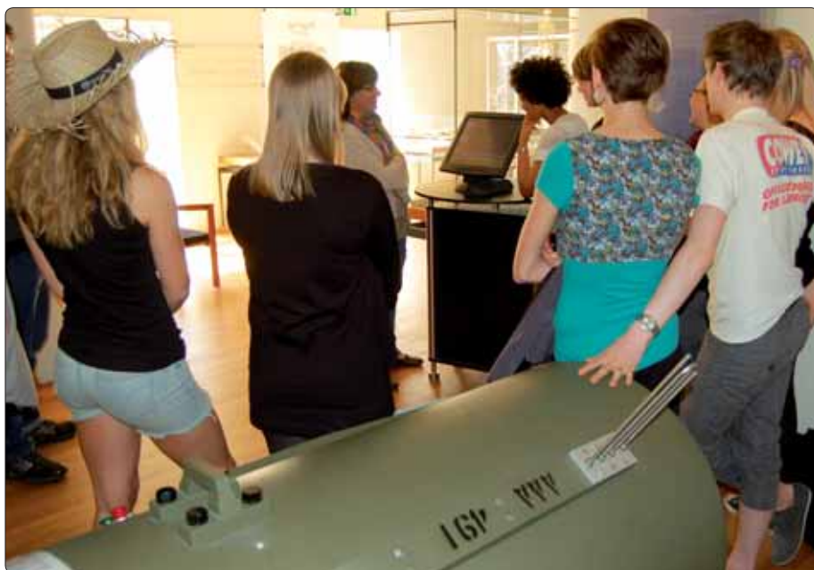
I forbindelse med offentliggørelsen af atombombeprojektet var der en lille reception på Steno Museet, hvor nogle af eleverne fra Egå Gymnasium fortalte om deres præsentationer ved atombomben

Læs mere om projektet, som er støttet af Region Midt og Kulturarvsstyrelsen, på www.intrface.dk .